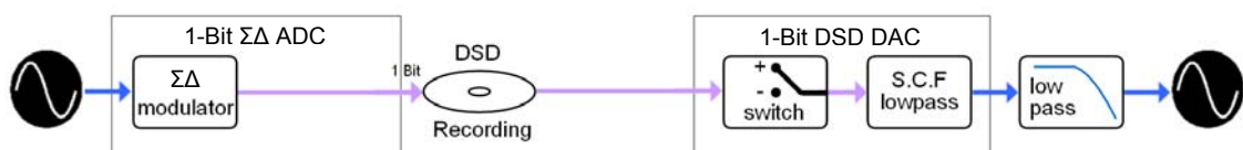
Grafik Nr.15: Signalfluss bei direkter Aufzeichnung des Ein-Bit-Signals. 25

Hier setzt nun die Idee von Direct Stream Digital (DSD) an: Ließe man das Dezimationsfilter, das Oversamplingfilter und den Sigma-Delta-Modulator einfach weg, und würde das Ein-Bit-Datensignal geradewegs aufzeichnen sowie direkt zu den analogen Tiefpässen auf der D/A-Wandler-Seite schicken, könnte man nicht nur einige Bauteile einsparen, sondern v.a. die steilflankigen Anti-Aliasing-Filter vermeiden. Auch wenn die Speicherung des ungefilterten DSD-Datenstroms mehr Kanalkapazitäten als notwendig erfordert, bedeutet der Wegfall natürlich eine sichtliche Vereinfachung und stellt einen naheliegenden Ansatz dar: